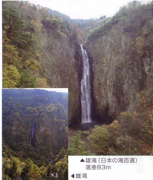
▲雄滝 (日本の滝百選) 落差83m