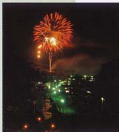
▲花火・ザ・宝泉寺

鳴子川溪谷の雄大な景色を満喫したら 九重の豊かな恵みも楽しもう！ 豊かな自然と温泉、季節の風景と楽しいイベント、 おいしいグルメ。チェックして！