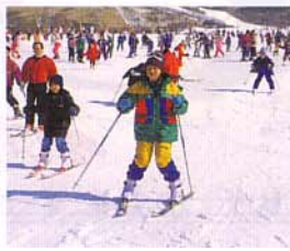
ウインタースポーツ▶