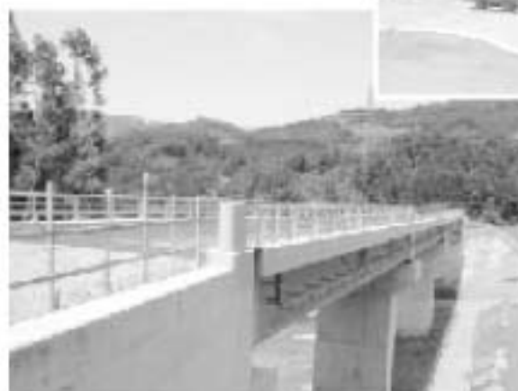
▲架設工事が進む前辻大橋。松木坂上地区からJA集出荷場への所要時間は、約半分に。