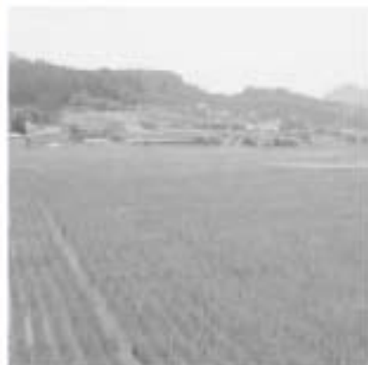
基盤整備を終えた町田の水田