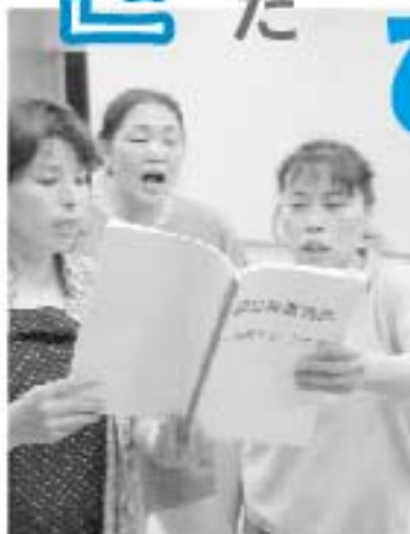
▲練習に熱が入ります。

「朝日長者物語」上演は10月16日、17日の2日間、新たな感動を与えてくれそうです。