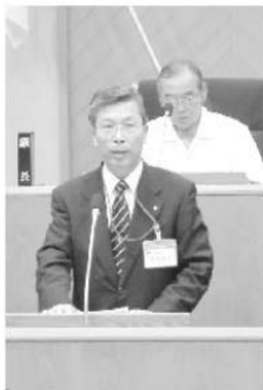
▲議会で辞職の理由を説明（6月23日）