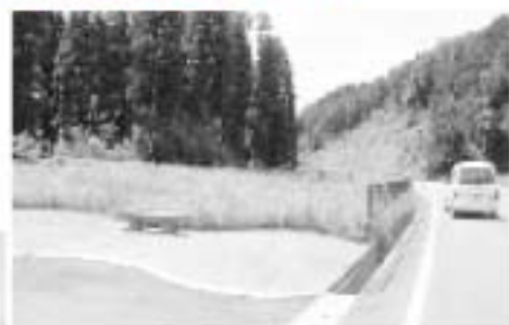
▲途中にはこんな憩いスペースも