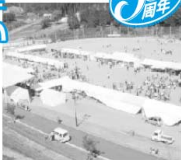
▲▼ 昨年のふるさと祭りから

九重町が誕生したのが1955（昭和30）年2月1日。来年2月で満50歳になります。九重町では、50周年を住民のみなさんと祝うため、さまざまな企画を準備しています。町の主催事業のほか、「住民が主役の町」にふさわしく、住民のみなさんが企画する事業を応援する取り組みもしていきます。