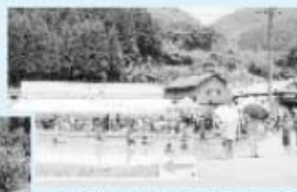
▲書曲では、どろんこ祭りなどで活用