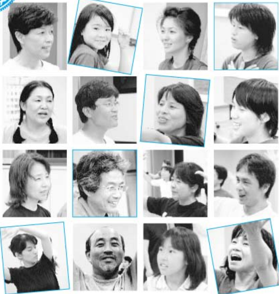
町制施行50周年記念事業 町国ミュージカル「朝日長者物語」 出演者のみなさん(4ページに関連記事)