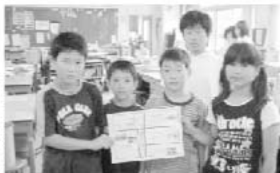
▶ コメコメ情報新聞編集部のみなさん