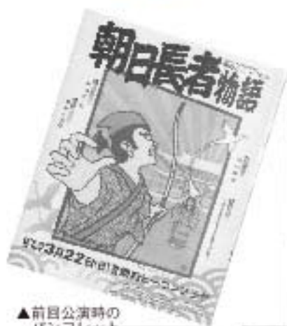
▲前回公演時のパンフレット