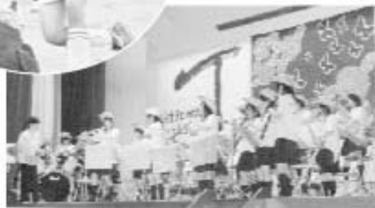
▶音楽部の発表（文化祭）

部活動： 20の部活動・同好会が充実した活動をしています。陸上部は毎年、北九州大会まで駒を並めています。本年度インターハイに出場したホッケー部は、大分県体育協会から有望強化指定校の委嘱を受けています。