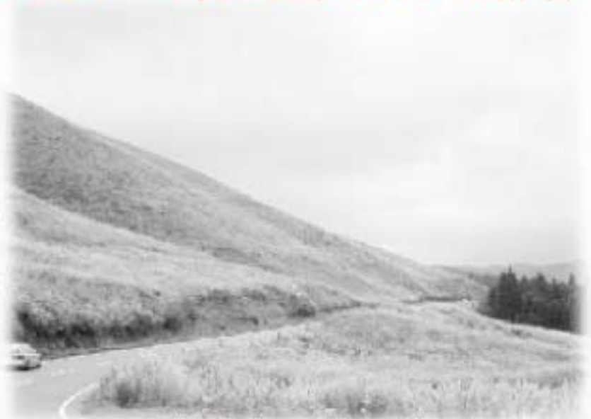
▲飯田高原は今、ススキがきれいです。