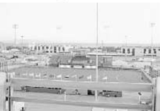
▲「競技場の光景で印象に残っていることですか？参加団の旗が並んで、はためていたことかな」