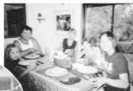
▲海外研修派遣事業（ホームステイ先にて）