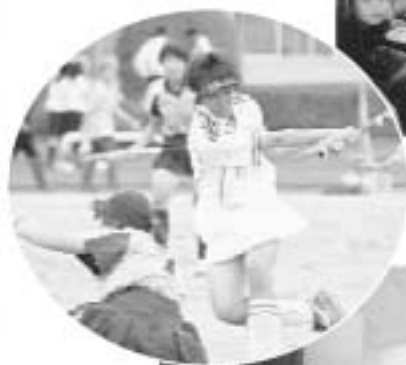
▼全九州高等学校ホッケー競技大会（決勝戦）