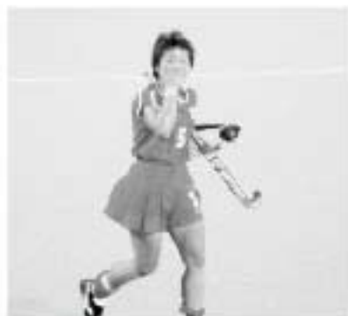
▲ニュージーランド戦に勝利して