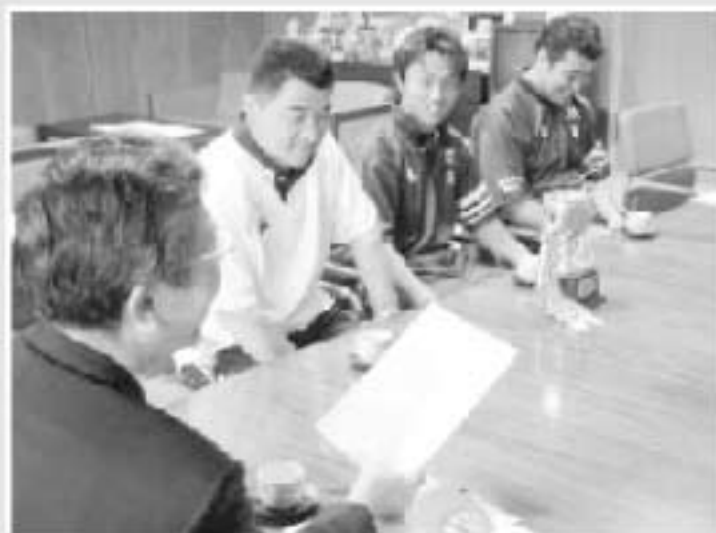
▲9月22日にはラグビー優勝の報告を、登壇は「玖珠クラブ(27人)」で週2回の練習をしています。「マネージャー募集中」とか。

「つなげよう 夢と感動 スポーツ大分」をスローガンに9月18日から20日までの3日間、大分・別府両市を中心に6市6町1村で大分県民体育大会が行われました。