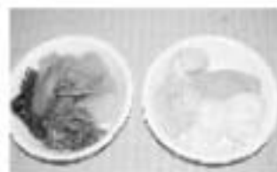
▲もうひとつの主演。会場を訪れた人には田舎料理が振舞われました。