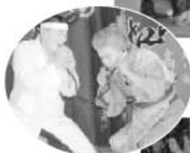
▲喜劇「ほうぼうが見たい」に会場は爆笑 ▶