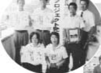
▲プロジェクト発表