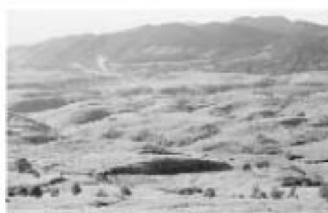
日出生台の一部、手前は「今宿」。向こう(白い煙)は小野原地区