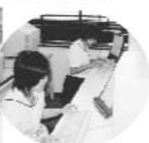
▲土曜講座（パソコン）