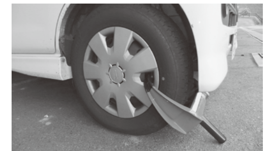
滞納対策のタイヤロック（車輪止め）