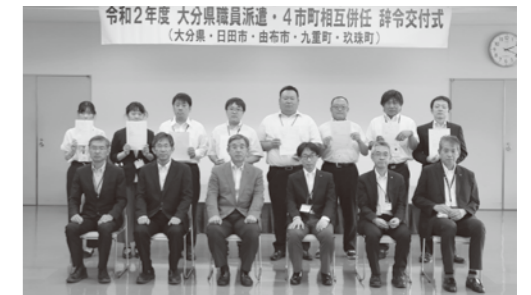
大分県職員派遣 4市町相互併任 辞令交付式