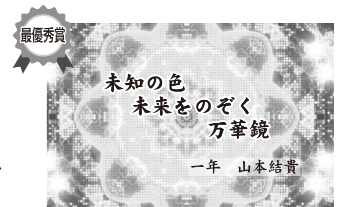
令和元年度最優秀賞の作品。 主催 このえ緑陽中学校「学校運営協議会」

入賞 得票総数の上位者を11月開催のこのえ緑陽中学合唱祭にて入賞者として表彰する