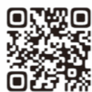
▲九重町のハザードマップ