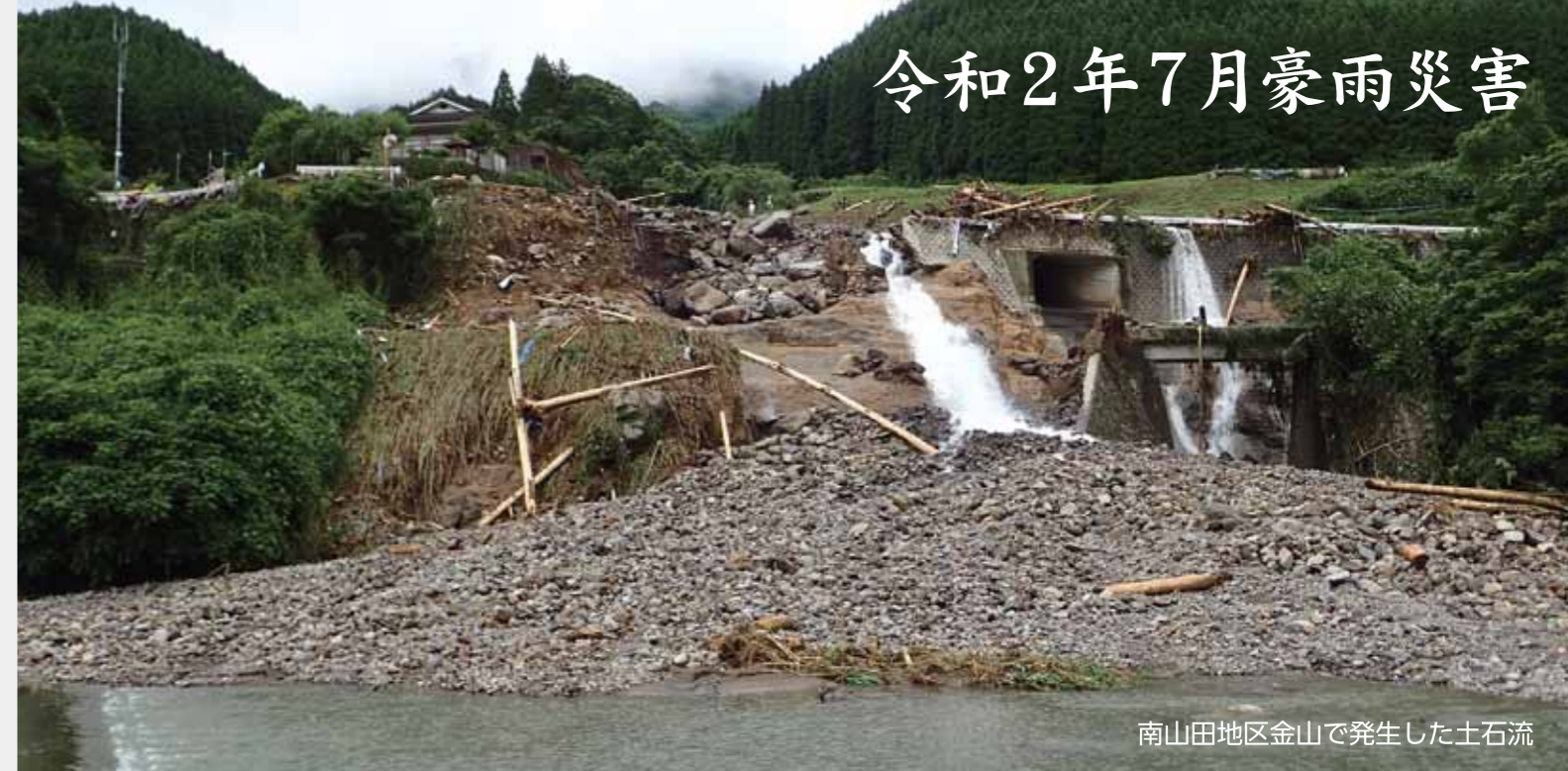
南山田地区金山で発生した土石流