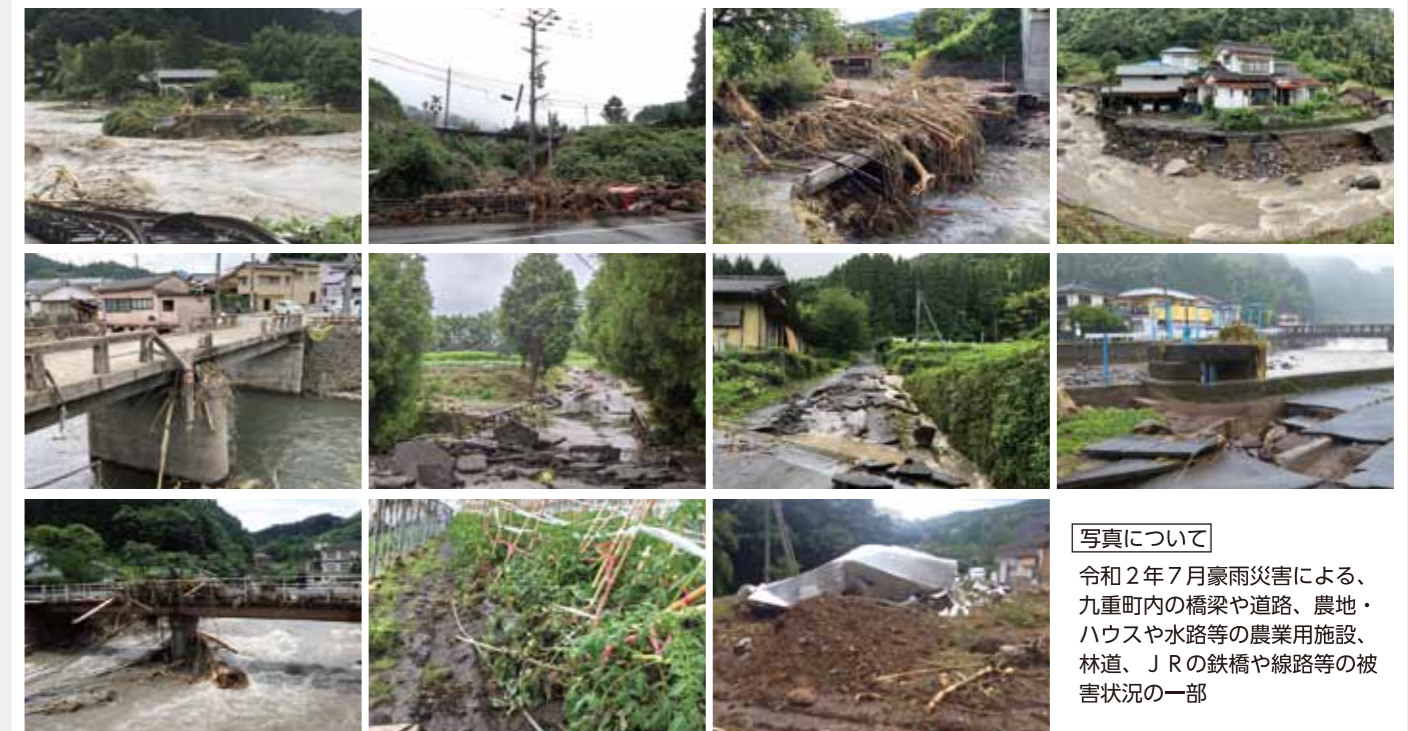
写真について 令和2年7月豪雨災害による、九重町内の橋梁や道路、農地・ハウスや水路等の農業用施設、林道、JRの鉄橋や線路等の被害状況の一部