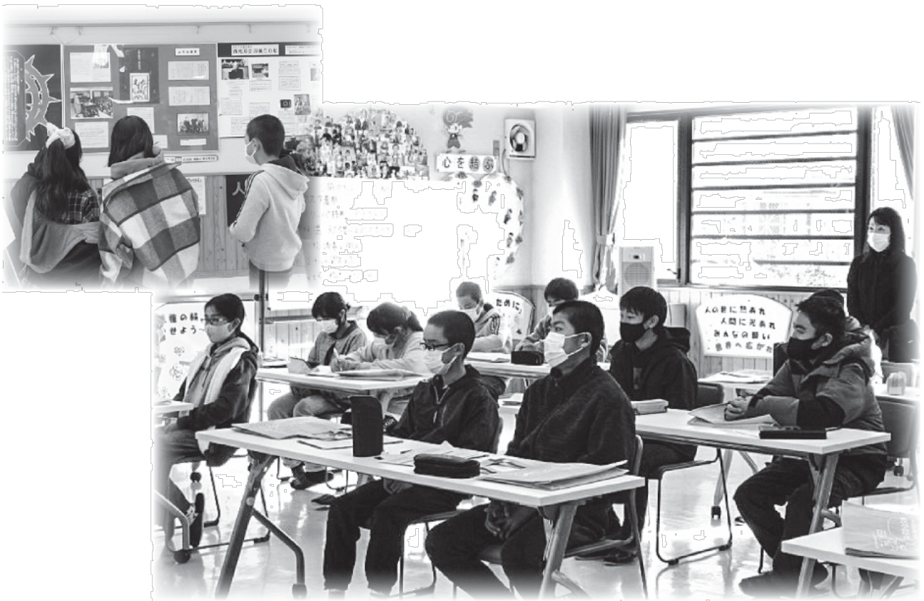
野上小学校6年生 隣保館学習