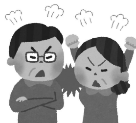
結婚問題での周囲の反対