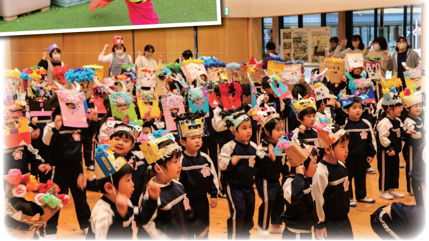
みつばこども園豆まき