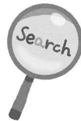
身元調査をすること