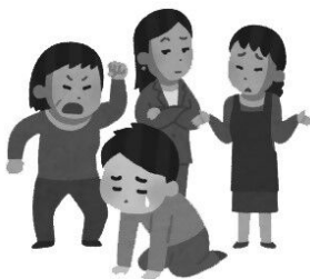
就職・職場での 差別・不当な扱い