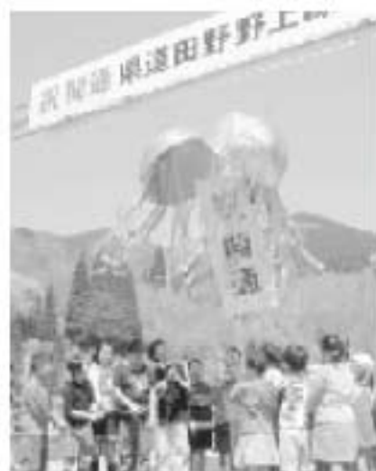
▲野矢小学校生徒によるくす玉割

この後、野矢小学校全校生徒によるくす玉割など、地域住民総参加の竣工式は和やかな雰囲気の中で行われました。