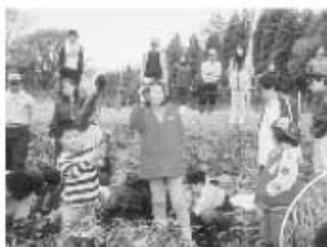
▲ 「野矢っ子探検隊」 自分たちの植えたさつまいもも収穫