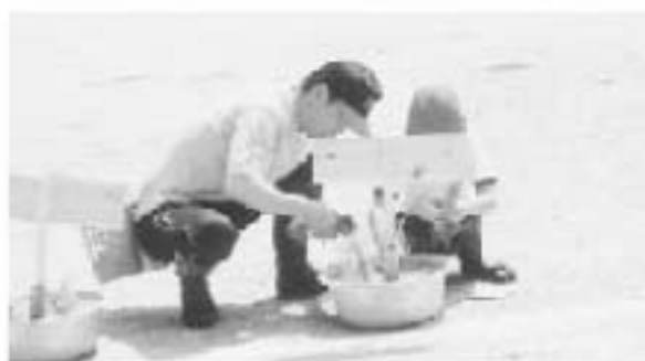
▲ 運動会「田植え」 前は2、3本ずつに分けて植えるんですよ

昔とった「きねづか」にこだわり「なわなիրレー」～老人会向け、「藁ごみりレー」～思い出人向け、「どん駄引きりレー・魚釣りりレー」～保護者・夢追い人向け、「田植え」～親子競技、という具合で、和気あいあいとした1日になります。去年田植えをした苗は、秋まで育て、学校文化祭で利用しました。