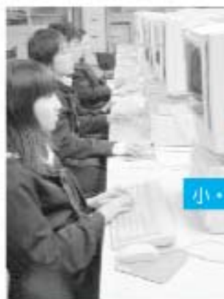
▲野上中学校での授業風景