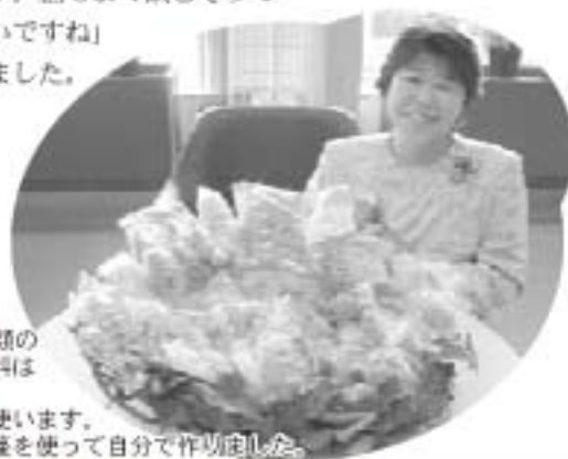
今日は17種類のお菓子。材料はなるべく地元のものを使います。器もアケビの壺を使って自分で作りました。