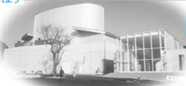
文化センター・保健福祉センター・ 公民館・隣保館