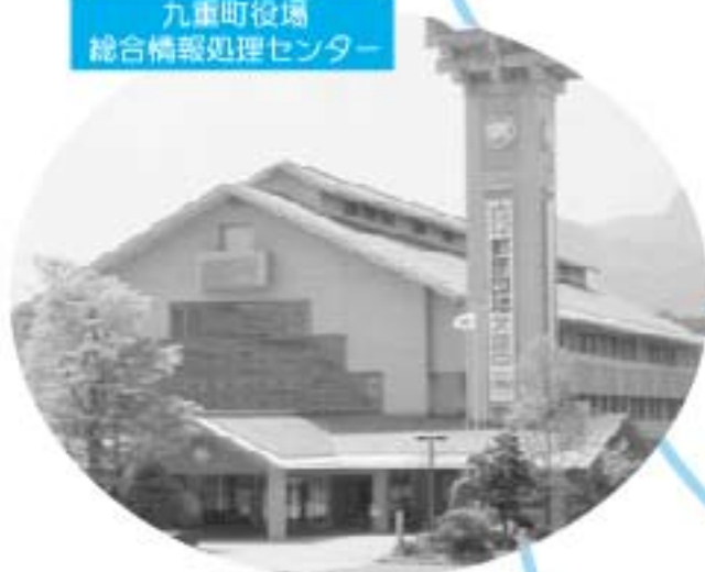
総合情報処理システム