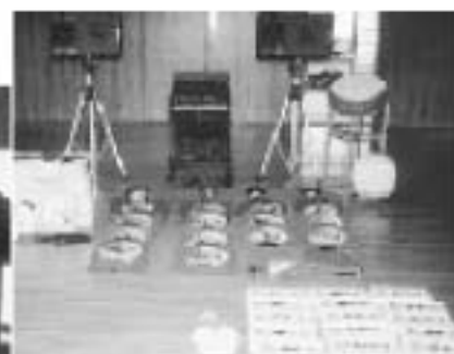
▲ひょっとこ踊り保存会へは「装束・面・音響一式他」を。