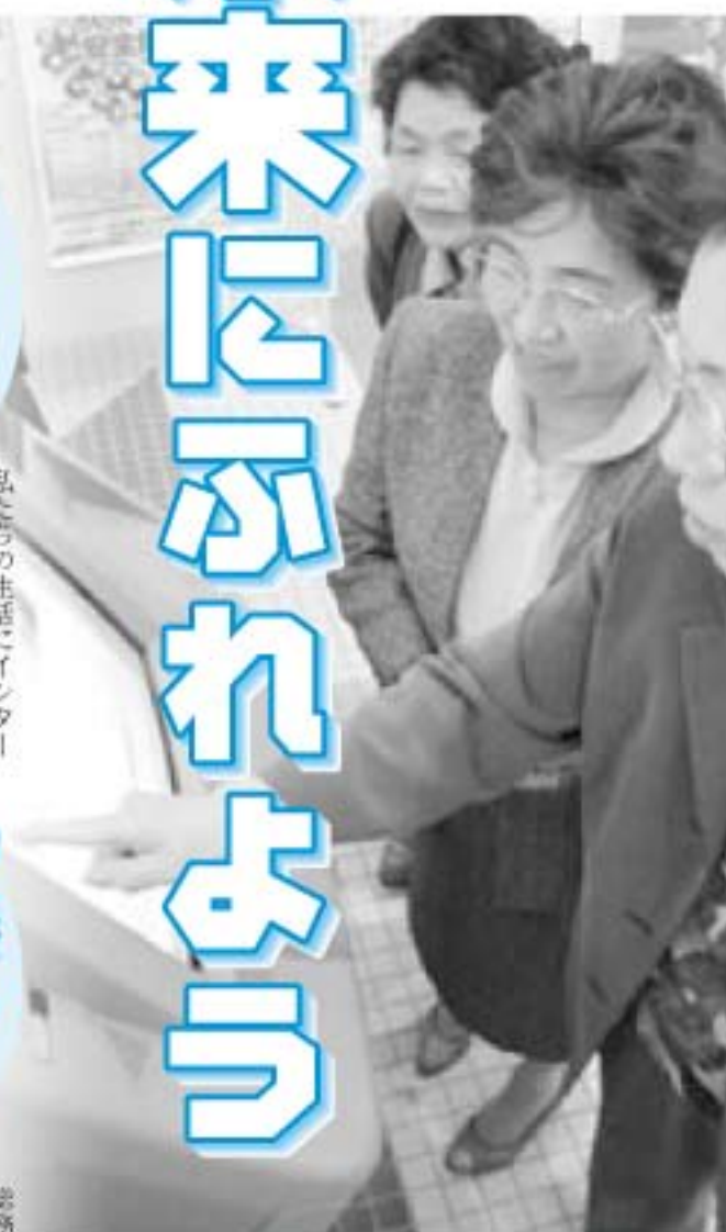
▲画面上で「スイス旅行」を体験中。 ～文化センターにて

ほんの20年前は夢のようなことが次々に実現している。こんなすごい時代に私たちは生活しています。