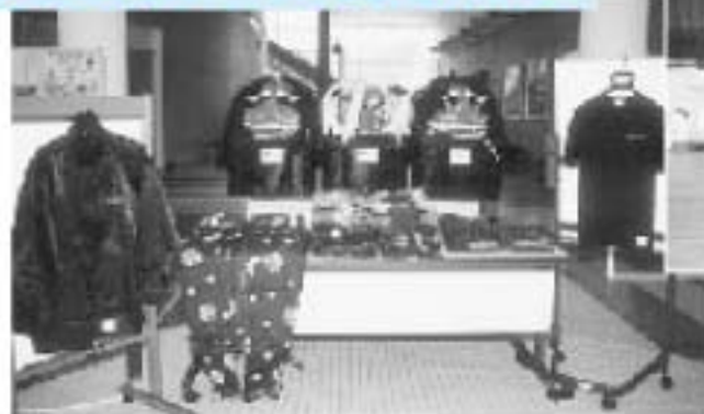
▲あばれ獅子保存会へは「獅子頭と装束他」を。

(財)自治総合センターでは、宝くじの普及広報を目的として文化振興事業やコミュニティ助成事業など各種の事業を実施しています。今回、一般コミュニティ助成事業により九重あばれ獅子保存会と九重ひょっとこ踊り保存会に対し、補助を行いました。