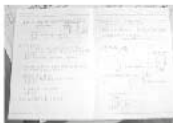
▶ 大隈さんのアイデアの秘密はこのノートにあります。