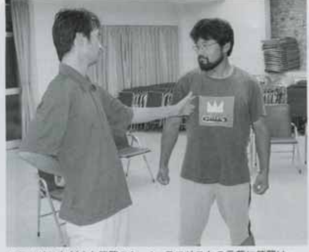
▲テロリスト(左)と熊襲のシーン。テロリストの言葉に熊襲は...

昨年の『新・東京物語』とは作品の雰囲気はまだ違うものに仕上がった今回の作品。それもそのはず、今回は野上中実在住の作家、林秀彦先生が劇団の座付き作家として劇団員の個性を踏まえて書き上げた作品。『前作は九重に来て初めての作品で、