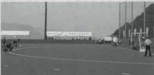
▲ペナルティー（ショート）コーナーの様子