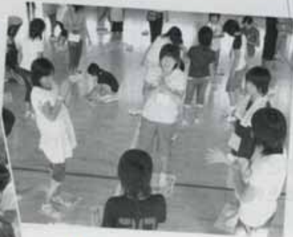
▲佐世保市立船越小学校との交流（8月22日）