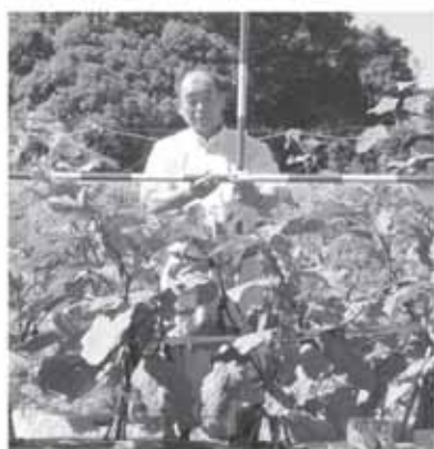
1 m 2 あたり 堆肥 1 kg施肥