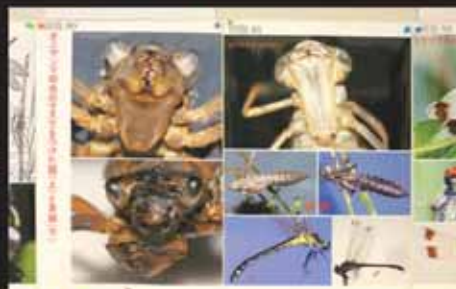
■オニヤンマ幼虫、ミヤマサナエ