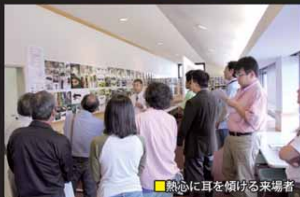
■熱心に耳を傾ける来場者