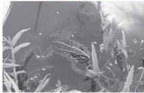
▲田んぼのトノサマガエル