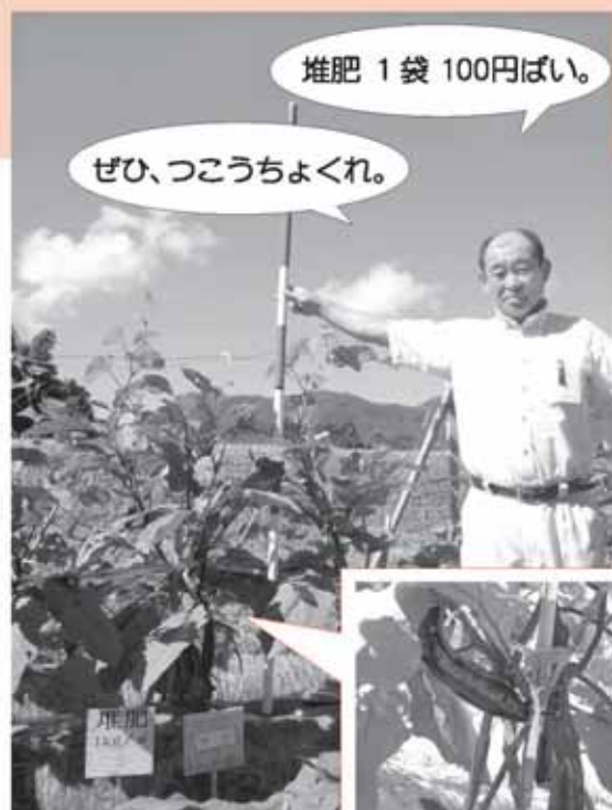
堆肥 1 kg/m 2 の『ナス』