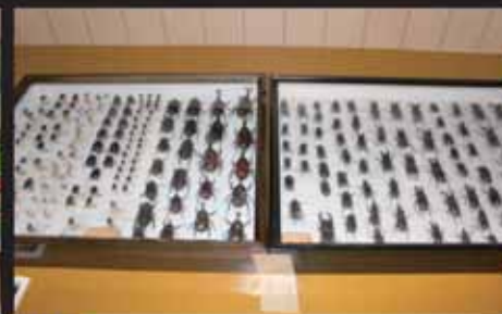
■カブトムシ・クワガタムシの標本