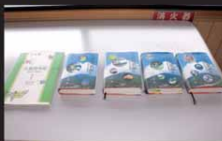
■現在、第10巻の原稿まで完成済み