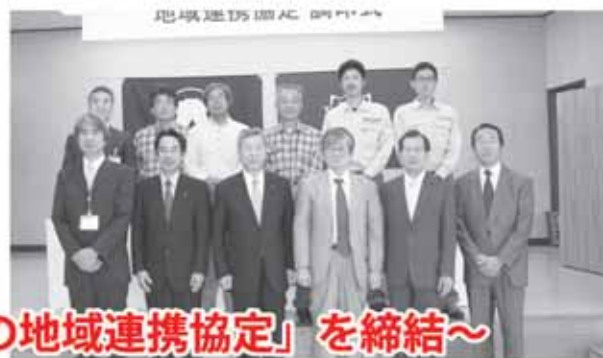
～「九重町と福岡大学との地域連携協定」を締結～

7月21日、長者原にある福岡大学やまなみ荘にて、九重町と福岡大学との地域連携協定調印式が行われました。この協定は、相互の発展と地域社会の発展のために、人材育成、教育・研究、文化、産業、まちづくり、健康・医療・福祉、自然・環境・エネルギーなどの多くの分野において、両者が連携し協力していくこととしたものです。