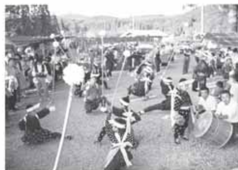
白鳥神社の白鳥楽