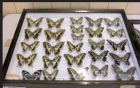
■アゲハチョウの標本