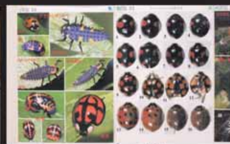
■テントウムシの斑紋変異