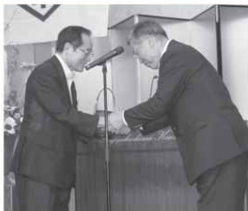
握手を交わす朝長市長（左）と坂本町長（右）

7月29日、佐世保市と九重町の姉妹都市締結20周年の記念式典が、多くの関係者の出席のもと佐世保市で開かれました。1952年に九重町の農家が農産物を佐世保中央卸売市場へ出荷したのを契機に、長年にわたり野菜や果物の供給が続けられてきました。そして91年7月に姉妹都市締結を行い、教育・文化・スポーツなどの多岐に渡る交流が続けてきました。式典には、坂本町長と佐世保市の朝長市長の他、市議・町議、各種農業団体など約150名が参加。今後のさらなる姉妹都市発展を祈願して、和太鼓の演奏や、坂本町長と朝長市長が巨大な「桶胴太鼓」を打つアトラクションが行われ、会場は盛り上がりを見せました。