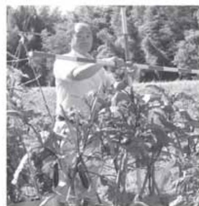
その他の方法で、行ったもの