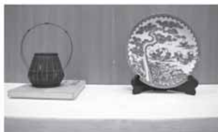
記念品として贈呈された、九重町の竹細工（左）と佐世保市の三川内焼（右）