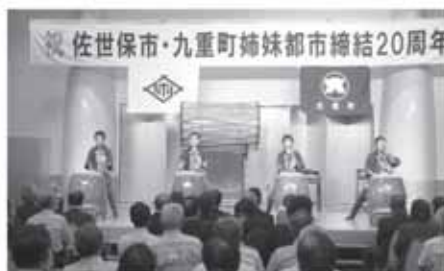
佐世保卸団地太鼓錬成会による和太鼓の演奏