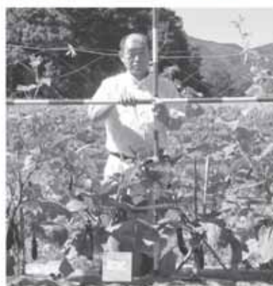
1 m 2 あたり 堆肥 0.5 kg施肥