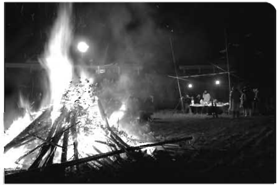
▶いろいろな料理に舌鼓を打ちました(引治)

都市部では、いろいろな要因によりどんな焼きの風習が廃れている傾向にあります。九重町内では、昔から変わらず多くの地域で盛んに行われています。その理由の一つとして考えられるのは、「地域の結びつきの強さ」ではないでしょうか。多くが行政区単位で行っているこの行事は、皆が集まって交流する貴重な場となっていて、バーベキューなどをしながらお酒や甘酒を飲むところが多く、「地域コミュニティで行う冬の祭り」としての一面があります。一方で、やぐらを組み上げるにも数日間かかり、決して楽にできるものではありません。地域内でリーダーシップを発揮する人、準備に協力を惜しまない地域の体制、つまり全体としての協働意識があるからこそ実施できているといえます。