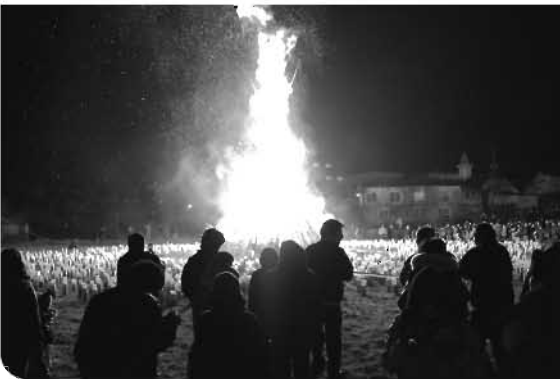
▶暖かさに引き寄せられるように人が集まります