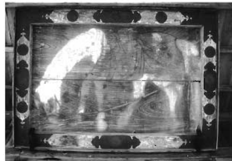
▲末広神社のお仮屋の大絵馬(白馬) (藩主久留島通嘉奉納)