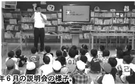
■昨年6月の説明会の様子。

南山田小学校（以下、南小）児童会の役員が1月23日に役場を訪れ、岩手県陸前高田市に送る「人権の花の種（マリーゴールド）」を教育長に手渡しました。