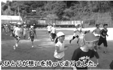
■一人ひとりが想いを持って走りました。