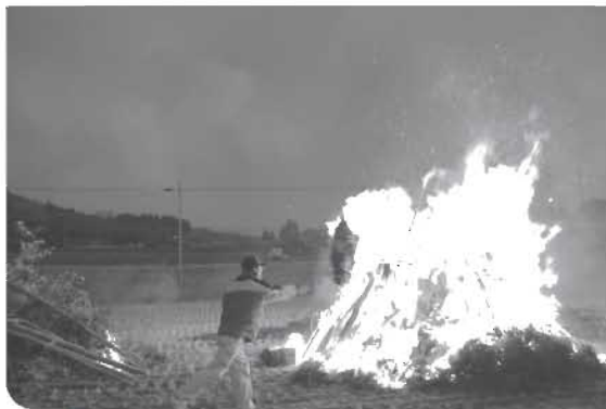
▲正月飾りなどを投げ入れる様子（奥野）

新春花火大会「花火・ザ・宝泉寺」。第24回目の開催となった今年も、多くの観客が宝泉寺温泉を訪れました。文字どおり花火が主となる大会ですが、このなかで開催される巨大などん