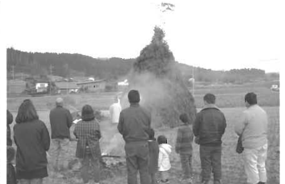
▲着火前に神事を行いました（奥野）