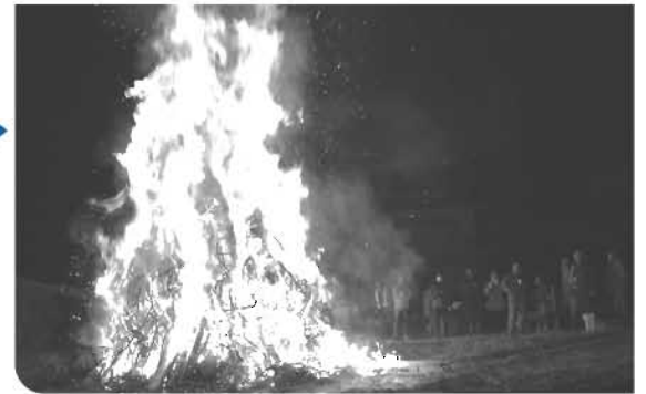
飛び散る火の粉に皆見入っていました（富迫）▶