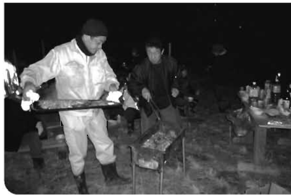
▶皆でバーベキューを楽しみました(金山)