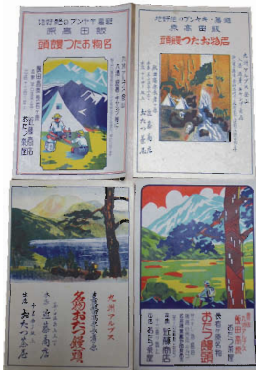
饅頭のレットテル

また、おたつ饅頭に添えたレットテルが、四種類で二十枚あり、レトロ調の懐かしい絵柄で貴重品。このように各界の人々に愛された人柄と、饅頭のうまさ忍ばれる。