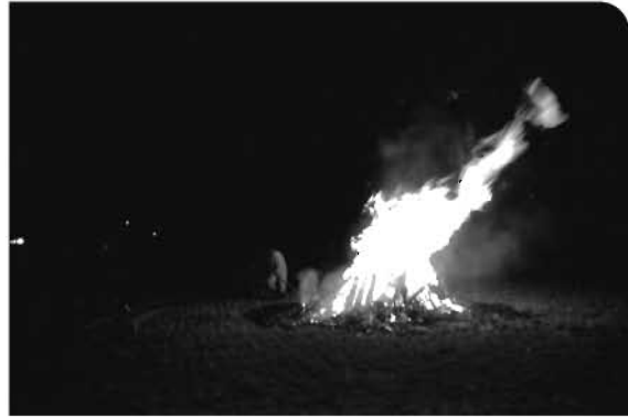
▶一気に燃え上がり小さくなった火を囲む(金山)