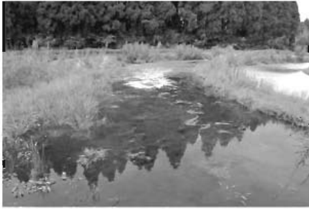
▲水生生物にとってのビオトープ