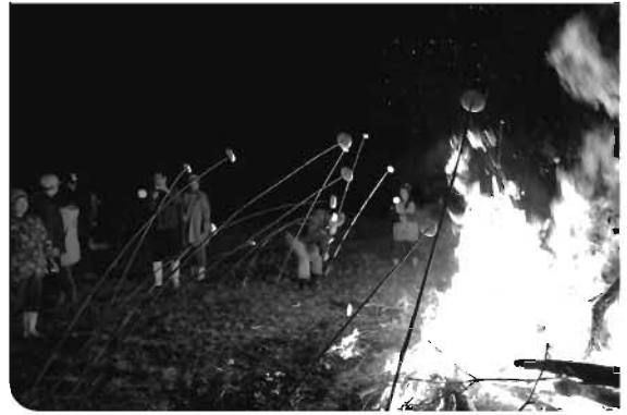
▶お餅を竹に刺して焼く様子(引治)