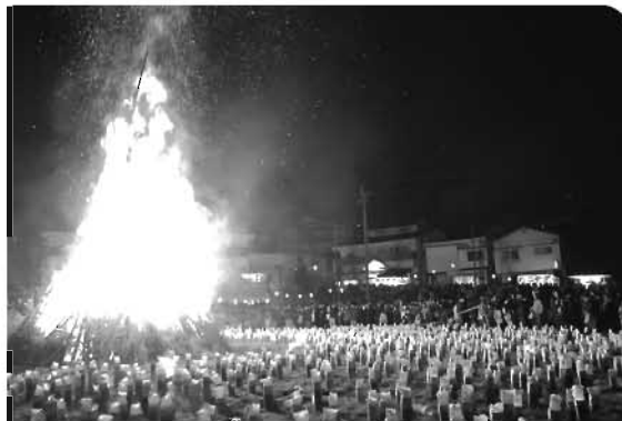
▶宝泉寺の巨大どんど。竹灯籠と共に辺りを照らしました

ど焼き(全高20・12m)も目玉の一つ。町外から多くの観客が訪れる観光行事の中で、ひととき注目を集めるプログラムとなっています。立ち上る巨大な炎は、非日常的なものとして、見る者を引き付けます。