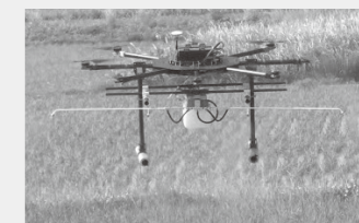
【写真】小型無人機(農薬散布の様子)