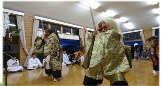
東部ふるさと祭り 庄内こども神楽