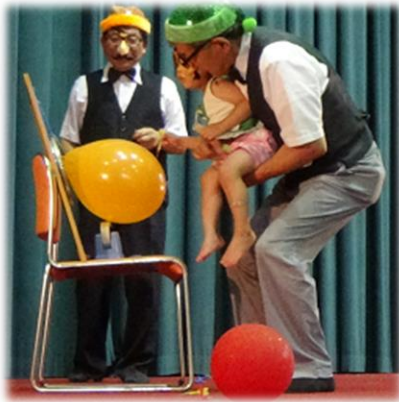
中部地区 おたのしみ会