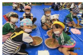
味噌のできあがり!!