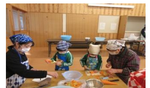
切り込みして芋ほり!