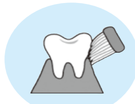
歯と歯ぐきの境目