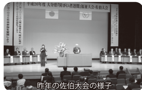
今年の佐伯大会の様子