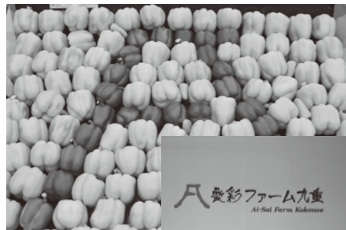
パプリカを使って施設名のロゴを作っていました

7月26日、(株)タカヒコアグロビジネス園芸施設(野矢)でパプリカ初収穫式が行われました。今後、パプリカは生活協同組合コープおおいた等に出荷し、販売される予定です。