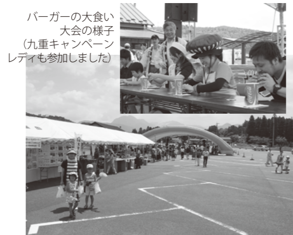
バーガーの大会の様子(九重キャンペーンレディも参加しました)

7月23、24日の両日、九重“夢”大吊橋で納涼フェスタが開かれました。特設会場では、豊後の網焼きなども販売され、楽しい夏祭りの雰囲気に来場者も大満足！さらに、九重“夢”バーガーの大会のほかに、様々なイベントが行われました。