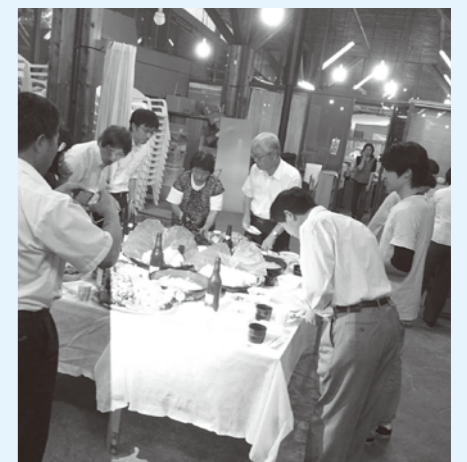
特産品開発の研修風景