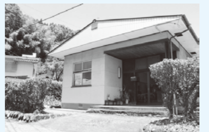
九重町教育支援センター