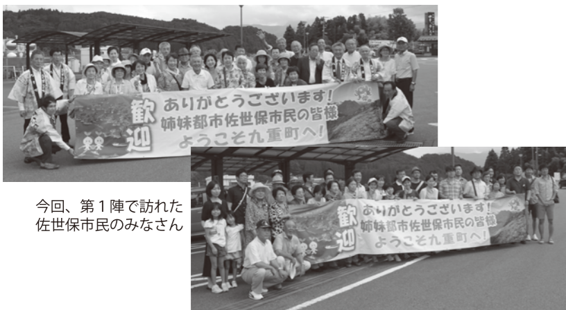
今回、第1陣で訪れた佐世保市民のみなさん

8月27日、姉妹都市の佐世保市の方々が九重町に観光で訪れました。今年発生した、熊本・大分地震で観光客が激減したことを受け、佐世保市と同市議会が復興応援ツアーを企画しました。 九重 夢 大吊橋で歓迎セレモニーが行われた後、九重やまなみ牧場やタデ原湿原を散策しました。宿泊場所では町の郷土芸能を観たり、温泉を満喫しました。 復興応援ツアーは、8月から9月にかけて4回訪れる予定です。