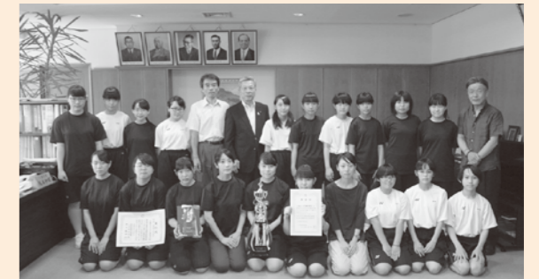
町長に金賞報告並びに南九州大会出場報告〔7月22日(金)〕

第12回南九州小編成吹奏楽コンテスト 開催場所：うるま市民芸術劇場（沖縄県）〔8月11日(祝・木)〕