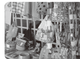
手作り製品の販売