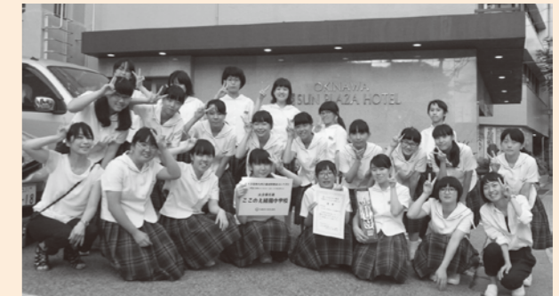
大会では銀賞受賞！

今年の夏、7月の大分県吹奏楽コンクールで、私たち吹奏楽部は金賞を受賞し、初めて南九州大会出場（沖縄県）が決まりました。