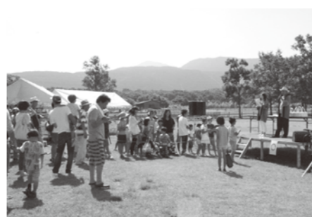
やまなみ牧場16周年祭の〇×クイズ