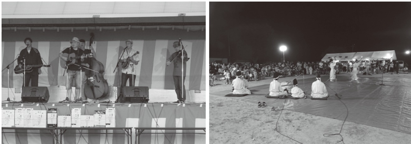
東部ふるさとまつりの様子

書類作成等、時間を要するため9月30日(金)までに役場企画調整課までご相談ください。皆さんの地域でもコミュニティ活動を充実させるために活用されてみてはいかがでしょうか。