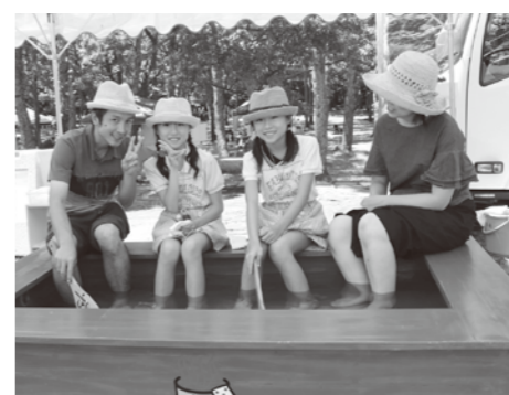
自然の中にある足湯も最高！

8月11日、くじゅうフェス2016が飯田高原の長者原園地で開催されました。今年から新たに祝日となった「山の日」を記念してのイベントで、4コースから選べる山歩き、自然に関する展示・体験、地元の食材を使ったスイーツ等のマーケットブースが多数出店し、夏休みの思い出づくりになりました。