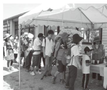
牛乳・飲むヨーグルトのおもてなし

8月21日、九州オルレ九重・やまなみコースの夏のイベントが開催されました。今回は参加者が約250人集まり、九重の自然を満喫しながらコースを歩いていました。 コースの途中、九重やまなみ牧場では16周年祭も開催されており、会場は来場者と参加者でにぎわっていました。