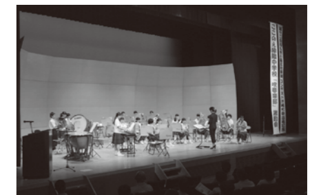
【写真】激励会の様子