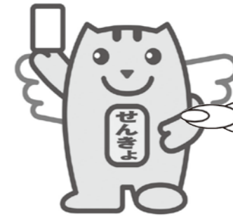
明るい選挙キャラクター 選挙のめいすいくん

今回の選挙は、私たちの暮らしに直接つながりのある大切な選挙です。明るく住みよい九重町を築くため、必ず投票しましょう。