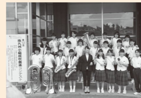
南九州大会出場！みんなで記念撮影！

第12回南九州小編成吹奏楽コンテスト 開催場所：うるま市民芸術劇場（沖縄県）〔8月11日(祝・木)〕