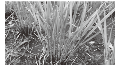
穂を出した稲刈り後のひこばえ

温暖化には温室効果ガスの排出等によって「人間よって進められている温暖化」と「地球の自然な気候変動による温暖化」の2種類があり、この2つは分けて考える必要があります。温暖化を感じる事象を全て温室効果ガスの排出のせいにするのではなく、地球の自然な気候変動の結果である可能性を並行して考え、温暖化に適応するために何が出来るかを考えるという柔軟性も持っておきたいと思いました。