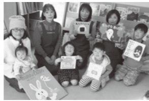
11月参加のおともだち

12月の担当は「チームそらめくん」のみなさん。1月は「スター」のみなさん（1月14日の予定）です。あたたかい図書館で一緒に楽しいお話聞きましょう♪おともだち、待ってま～す！