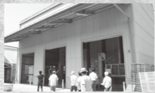
〔視察〕豊後高田市(乾燥施設)