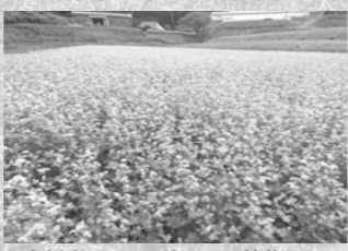
播種1か月後 開花期