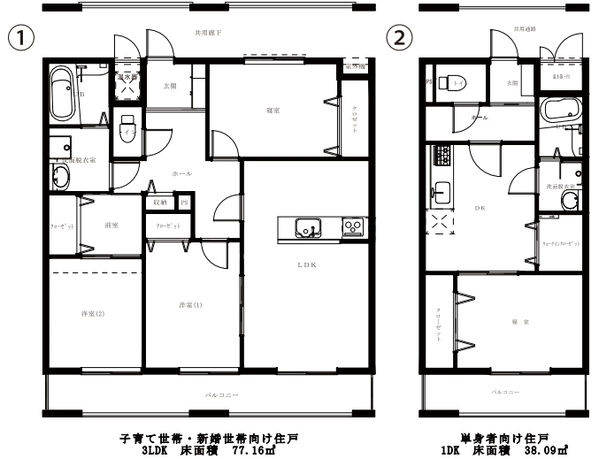
子育て世帯・新婚世帯向け住戸 3LDK 床面積 77.16㎡