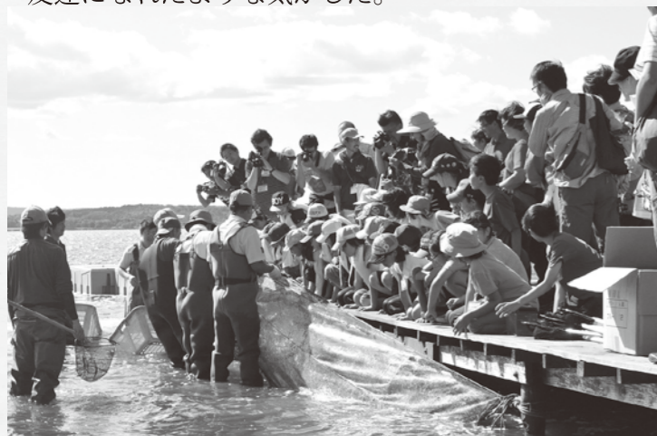
クッチャロ湖での漁を見学