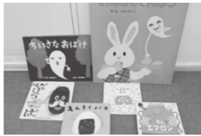
一緒に楽しんだ絵本です