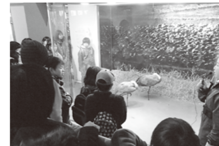
▲ツル博物館で事前学習

まず訪れたのはツルの越冬地・出水市です。ここではツルへの給餌や、夕ヌキやイタチに襲われないように浅く水を張った湿地をねぐらとして用意するなどの官民一体となった保護活動が行われており、ツルたちは安心して越冬することができます。それらの保護活動の結果、今では1万羽を超えるツルが集まる世界最大のツルの越冬地となっています。実際に目にする万羽鶴は壮観で、朝日を浴びてねぐらから飛び立つ様子は非常に美しく、世界中でここで見られないこれらの風景は子供たちの心に深く残ったようです。