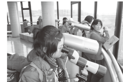
▲ツル観察センターからツルを観察