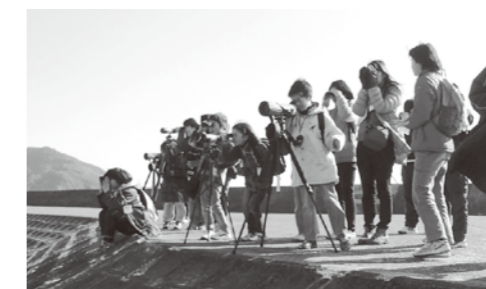
▲川岸からクロツラヘラサギを観察

夏以来の訪問となった錦江湾ではクロツラヘラサギの越冬している様子をじっくりと観察することができました。しかし、クロツラヘラサギの越冬地は出水市のツルの越冬地と異なり、保護区に指定されるなどの法的な保護対策が取られている場所ではありません。言わば、ちょっとしたきっかけで開発されてしまう可能性のある場所であり、のんびりと羽を休めるクロツラヘラサギたちからは貴重な自然が守られている素晴らしさと、いつ失われてもおかしくない危うさを同時に感じました。