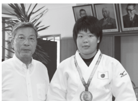
昨年7月、ユニバーシアード柔道ロシア大会女子78kg級で銅メダルを獲得し、8月に町長報告を行いました。

学に入る以前から寝技に力を入れて練習をしてきました。逆に立ち技は、まだまだ達しなくてはと思っています。