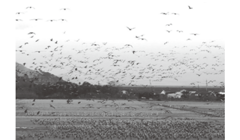
▲1万羽を超えるナベヅル・マナヅルの越冬

夏以来の訪問となった錦江湾ではクロツラヘラサギの越冬している様子をじっくりと観察することができました。しかし、クロツラヘラサギの越冬地は出水市のツルの越冬地と異なり、保護区に指定されるなどの法的な保護対策が取られている場所ではありません。言わば、ちょっとしたきっかけで開発されてしまう可能性のある場所であり、のんびりと羽を休めるクロツラヘラサギたちからは貴重な自然が守られている素晴らしさと、いつ失われてもおかしくない危うさを同時に感じました。