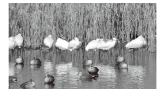
▲錦江湾のクロツラヘラサギ

出水市と錦江湾の置かれた状況は異なりますが、共通して感じたことは、どちらもその場所の自然や越冬する鳥たちを守りたいという地域の人たちの思いがその地域の自然を守っているのだということです。クロツラヘラサギの越冬地を守っているのは間違いなくその地域の人たちの声です。出水市にしても地域の人たちの理解と努力なくして世界一のツルの越冬地にはなりません。それぞれの地域をどのような場所にしていくかを決めるのは、他でもないその地域に住んでいる人々たちです。それは九重町も例外ではありません。将来の九重町を担う子どもたちに「自分たちの町の在り方を決めるのは自分自身」ということを感じてもらうことができた、実りあるキャンプだったと思います。