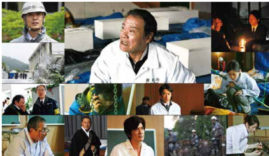
(c) フジテレビジョン