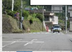
⑧朝の通学時バイパスが きたこととばす人が多い。