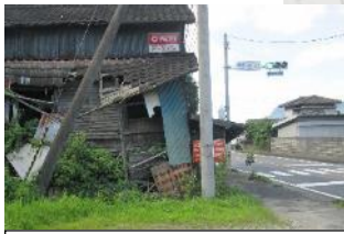
①粟野バス停付近⇒横断歩道前に倒壊し かけの家あり。(前を通る)