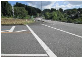
③旧道に入る場所⇒児童横断するが、歩道なし。