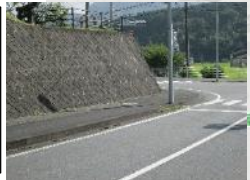
④引治三差路 バイパスには曲がり箇 所のみガードレール