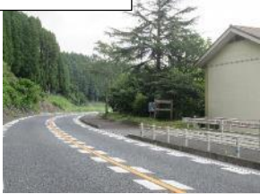
⑥学校から宝泉寺方面はガードレールがある が、引治方面は、学校入り口はなし。