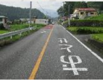
⑧朝の通学時バイパスがで きたこととばす人が多い。