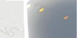
⑦引治トンネル⇒児童が通 り抜けるがライトが少ない (暗い)