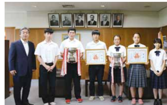
出場報告に訪れた、玖珠美山高校の男子・女子ホッケー部の代表、少林寺拳法部、美術部の皆さん

「全国高等学校総合体育大会（インターハイ）」に出場される玖珠美山高校の男子・女子ホッケー部、少林寺拳法部及び「第45回全国高等学校総合文化祭」に絵画を出展される美術部が町長に報告に訪れました。町長は「全国大会は貴重な体験になります。全力で頑張ってください」とエールを送りました。