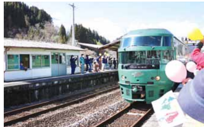
式典が行われた豊後中村駅では、「ゆふいの森1号」を皆さんで歓迎しました

3月1日に令和2年7月豪雨により不通となっていたJR久大本線の開通イベントが行われました。この日は豊後中村駅で式典が行われ約150人が参加しました。また、各駅で地域の方々や小学生が手旗で歓迎したほか、沿線でバルーンリリースのイベントが行われる等、多くの方がJR復旧を喜びました。