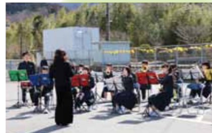
このえ緑陽中吹奏楽部による「小さな祝典音楽」「士官候補生」等が演奏されました

3月1日に令和2年7月豪雨により不通となっていたJR久大本線の開通イベントが行われました。この日は豊後中村駅で式典が行われ約150人が参加しました。また、各駅で地域の方々や小学生が手旗で歓迎したほか、沿線でバルーンリリースのイベントが行われる等、多くの方がJR復旧を喜びました。