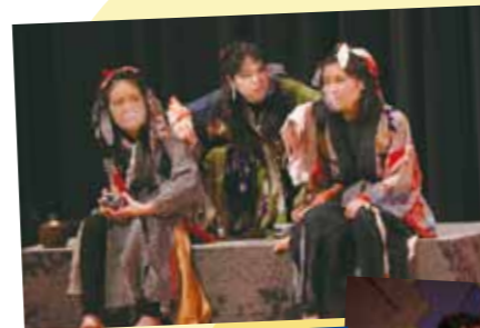
びんぼう神様さま

演劇教室の参加者は未就学の園児から小学生、中学生が参加し、約4カ月受講した成果を発表しました。