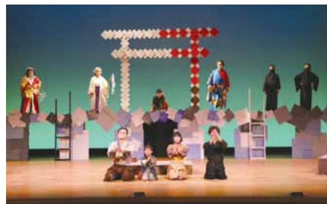
笑いあり涙ありの70分間にお客さんからは大きな拍手が送られました

九重町民劇場による演劇教室の発表会として、貧乏神を祀った家族を題材とした演劇『びんぼう神様さま』が九重文化センターホールで上演されました。