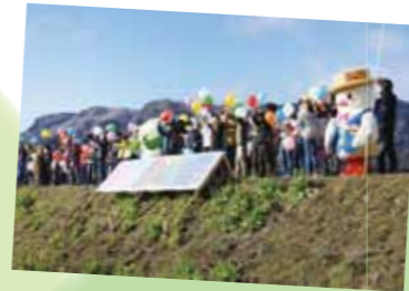
東飯田地区の沿線