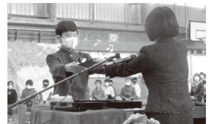
3月24日…南山田小学校の卒業証書授与の様子。