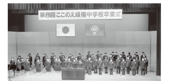
3月5日：ここのえ緑陽中学校 60名の卒業生。