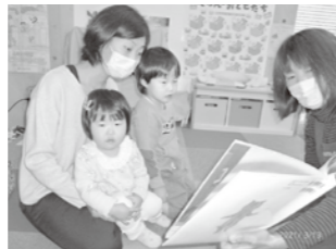
3月のおはなし会の様子

4月のボランティアグループは「チームそらまめくん」の皆さんでした。5月は「スター」の皆さんです。（5月8日予定）☆おはなし会は赤ちゃんから大人まで楽しめますよ。児童コーナーにて開催していますので、図書館にいらした際はお気軽にお立ち寄りください。