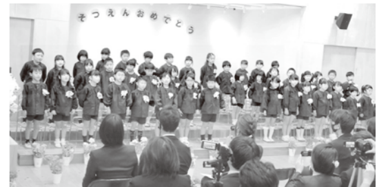
3月18日：みつばこども園 43名の卒園児童。同日に飯田こども園でも卒園式を行っています。