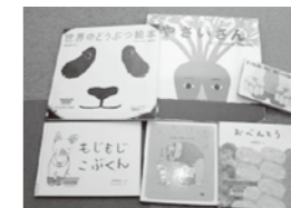
おはなし会で読んだ本

5月の担当グループは「スター」のみなさんでした。6月は「ぶちトマト」(6/12予定)のみなさんです。手あそびや紙芝居など、おうちでの読み聞かせとはちょっと違う「おはなし会」を楽しみに来てください。来てくれたお友だちにはささやかなプレゼントを計画中です!キラキラシールも選んで貼ってね!