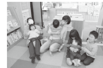
4月のおはなし会の様子