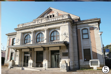
①九十九島（石岳展望台）②九十九島カキ ③黒島天主堂 ④三川内焼 ⑤佐世保市民文化ホール