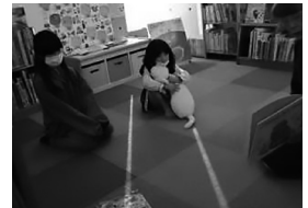
▲11月のおはなし会の様子

※DVDは破損するおそれがありますので、お手数ですがセンター内事務室までお願いします。