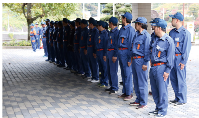
九重町役場で行われた出発式後、各部防火パレードに向け出発しました

九重町消防団が秋の全国火災予防運動の一環として、防火パレードを行いました。11月9日は「119の日」とされ、九重町消防団では毎年この日に合わせ、パレードを行っています。