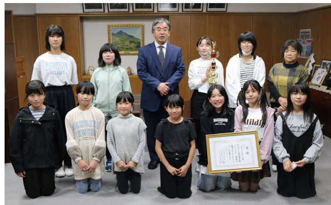
日野町長とこども屋台選手権出場者の皆さん

10月22日に大分市で開催された第8回こども屋台選手権で3位の結果を残した出場者の皆さんが町長への報告に訪れました。