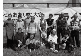
大分県障がい者スポーツ大会に出場

活動で会員の方・地域の方・他地域の方などと交流を図る他、社会福祉協議会や行政、関係団体とも連携を取りながら障がいに関する様々な課題解決に取り組んでいます。