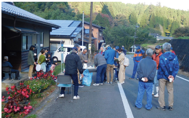
区長を中心に声をかけあいながら避難しました。

11月5日、野矢地区で避難訓練が行われました。午前8時に警戒レベル3高齢者等避難が発令されたという想定で行政区ごとに避難を行い、今回は新たな取り組みとして、グループラインを利用した連絡体制の確認も行いました。