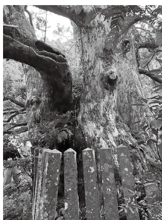
菅原の大力ヤの木

ふるさとの価値は、昔から引き継いできた文化や伝統、そして人々の心を育んできたこうした自然や木々の存在ではないかと思う。誰も関心を持たず、自分に関係がないとして放置することがあれば、それは、故郷を失うということではないか。郷土史教育の中でこうしたことを引き継ぎ、町としても保護に万全を期すべきたと痛感させられた調査であった。