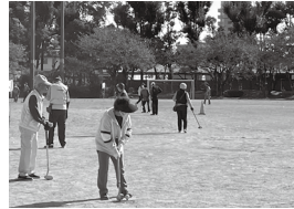
グラウンドゴルフ大会に出場