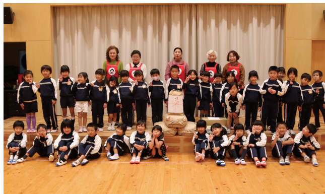
九重みつばこども園5歳児クラスの子どもたちと大分県農業協同組合ここのえ女性部の皆さん

11月14日、大分県農業協同組合ここのえ女性部よりみつばこども園へお米が贈られました。