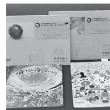
▲おはなし会で読んだ本

春ですね。図書館で楽しい時間を過ごしませんか。赤ちゃんから小学生、そして大人も一緒に絵本の世界へ♪ ※マスクの着用をお願いします。