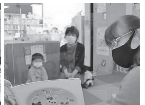
▲3月おはなし会の様子