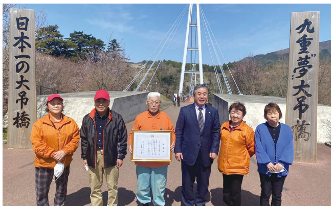
日野町長と大吊橋清掃管理組合の方々