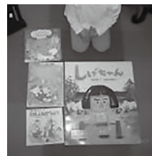
▲おはなし会で読んだ本