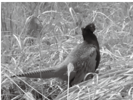
日本の国鳥・キジ

とは言えどもキジは時代が変わっても国鳥にふさわしい鳥であるという点は変わらないのではないかと思います。キジを美しいと感じる感性や桃太郎などを通してなじみ深いという点は、我々が世代を重ねても変わることなく受け継がれていくことと思います。時代と共に様々なものが移り変わりますが、日本人の琴線に触れる文化の根っこはいつまでも変わらないのかもしれない。