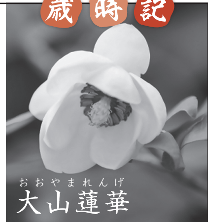
おやおまれんげ 大山蓮華

大山蓮華は奈良県の大 山に群生地があり、大山 にハスの花を咲かせる というのが名の由来。 上五の「約束の空」は何 を意味するのか、読者の 想像は無限に広がります。 ちなみに、大山蓮華の 花言葉は「変わらぬ愛」 俳句ならではの美しい 無言の叙情詩です。