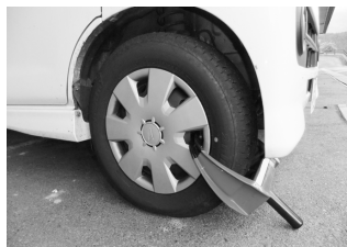
◀滞納対策の タイヤロック (車輪止め)