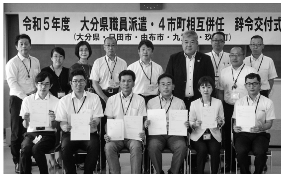
大分県職員派遣 4市町相互併任 辞令交付式

また、納期限を過ぎると延滞金が発生する場合がありますので、納期内納付をお願いします。