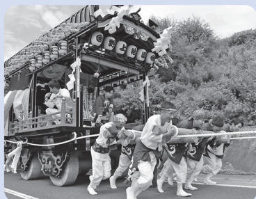
▲野上まちづくり協議会