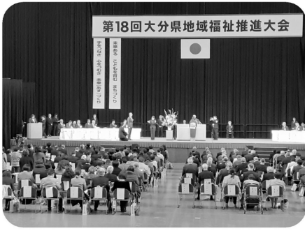
ビーコンプラザ コンベンションホールにて

この大会は、県内の社会福祉関係者が一堂に会し、多年にわたり社会福祉の向上に尽くされた方々に感謝の意を表することにより、地域福祉の一層の発展に資することを目的としています。 九重町から次の方々が表彰されました。