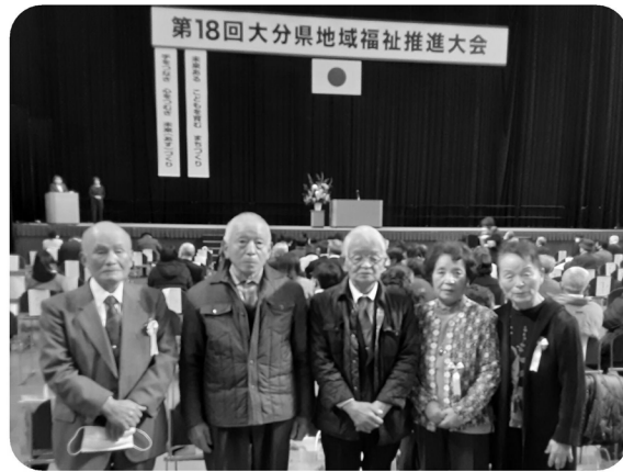
受賞者の皆様、おめでとうございます！