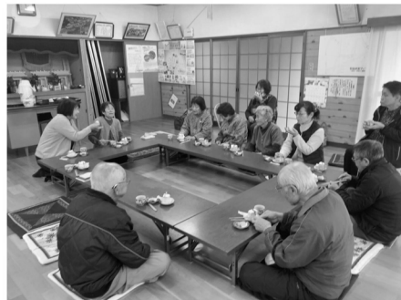
お茶を飲みながらの 久しぶりのおしゃべり

十一名の方が集まり、久しぶりに会う方も、「あんた誰じゃったかな？」「何年ぶりじゃろか？」と、近所に住んでいても、なかなか会う機会がないことがよく分かりました。