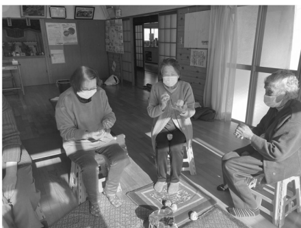
昔を思い出してお手玉遊び！ なかなか上手いきません。

と、また一人仲間が増えました。サロンと言えば、高齢者が参加するところと思っている方がまだまだ多くいるようですが、今やサロンは、一番身近な所で誰もが集える場所として、各地区に広まりつつあります。今日もどこかで大きな笑い声が響いていますよ。