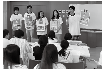
地域と子どもの国際交流の様子 (6カ国 計35名の参加)

先日、文部科学大臣より「全国優良公民館賞」を頂きました。これまで東飯田公民館の主事が継続してきた事業とそれを支えてくださった地域の皆さまに贈られた賞です。これからも学習・交流の拠点として、また皆さまにとって一番の窓口で在り続けます。