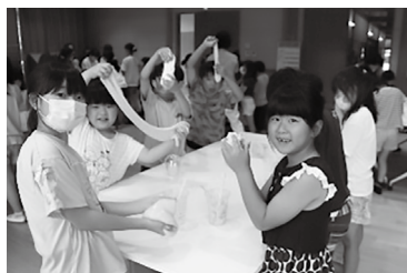
放課後チャレンジ教室