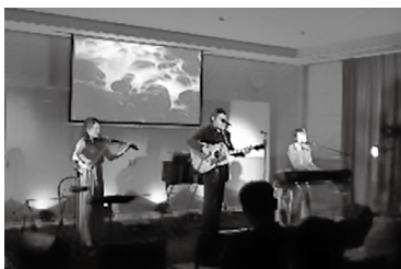
コンサートの様子

特に用事がなくてもいつでもお気軽にお茶を飲みに来てください。お待ちしております。