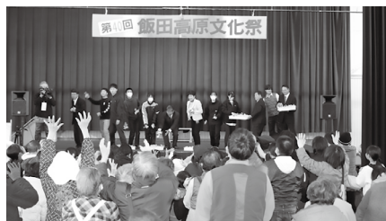
飯田高原文化祭の様子