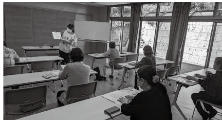
スマホ・パソコンの使い方講座も実施

ここでは、季節ごとに様々な活動が行われております。まちづくり協議会、地域の方々による文化祭やひなまつり、祇園実行委員会による各種活動などがあります。その他に、健康増進を目的に体操や健康マージャンをはじめ、キッズダンスやヨガ等幅広い世代の方が活動をしたり、スマホやパソコンの使い方講座や相談を受けたりもしています。