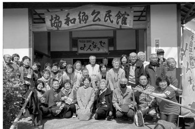
協和郷のボランティアの皆さんと記念撮影