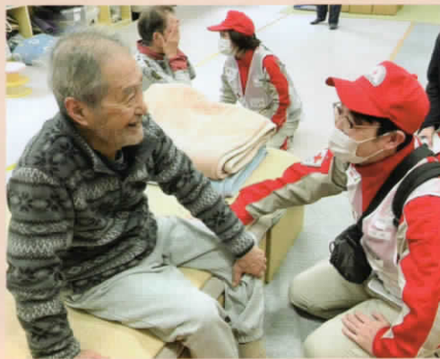
被災地で活動する日赤大分県支部救護班(石川県七尾市)