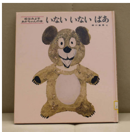
いないいないばあ