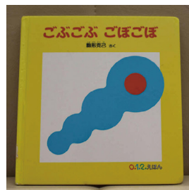
ごぶごぶごぼごぼ