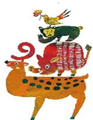
このえ子育て交流センター ブレイメンズ