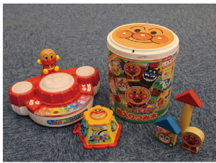
みんな大好き アンパンマン

おもちゃと本の貸し出しを行っており、2週間借りる事ができます。 おもちゃ202個、絵本3383冊を貸し出しています。