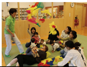
わくわく広場・リズム遊び

♪乳幼児親子対象：「わくわく広場」「ベビーニコニコ広場(ベビーマッサージ・絵本の日)」「リズムトレーニング」