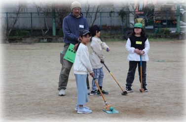
グラウンドゴルフ