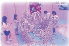
最後に塔を壊すのもドキドキして楽しかったです。