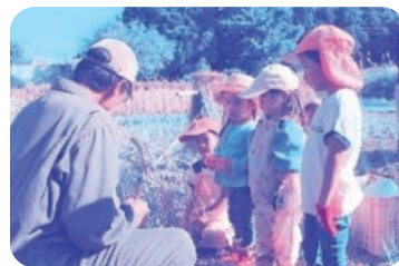
10月10日「稲刈り」をしました。最初に鋤鎌の使い方を教えてもらいます。