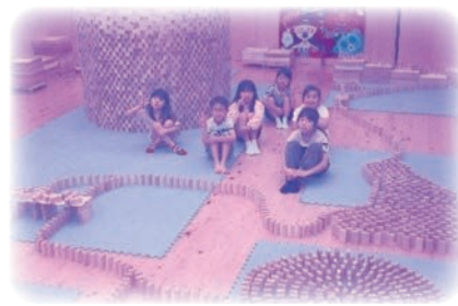
10月4日に「ドミノ」作りをしました。長いドミノと塔が出来ました。