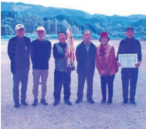
優勝した飯田Aチームの皆さん おめでとうございます！