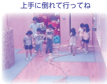
上手に倒れて行ってね