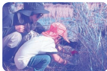
上手に刈れるかな？