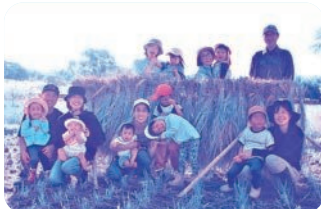
頑張って掛け干したよ。美味しいお米になーれ