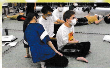
大分県脳性まひ児者父母の会