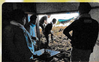
災害ボランティア支援