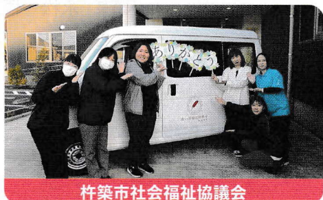
杵築市社会福祉協議会