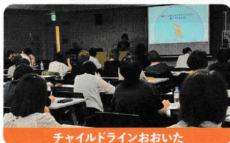
チャイルドラインおおいた