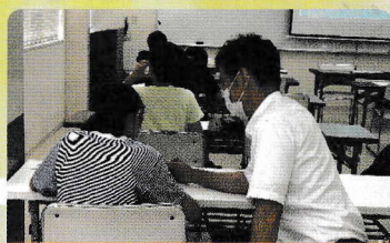
地域の宝育成支援センター