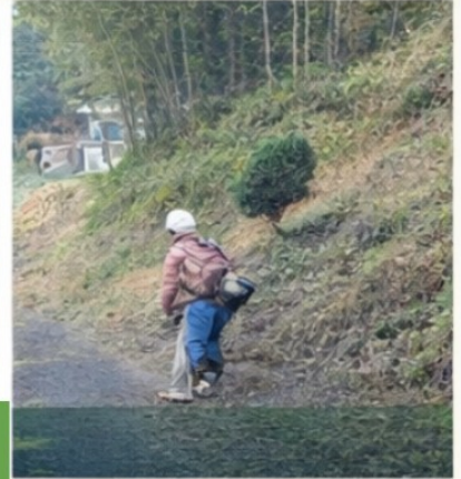
草刈り作業の様子