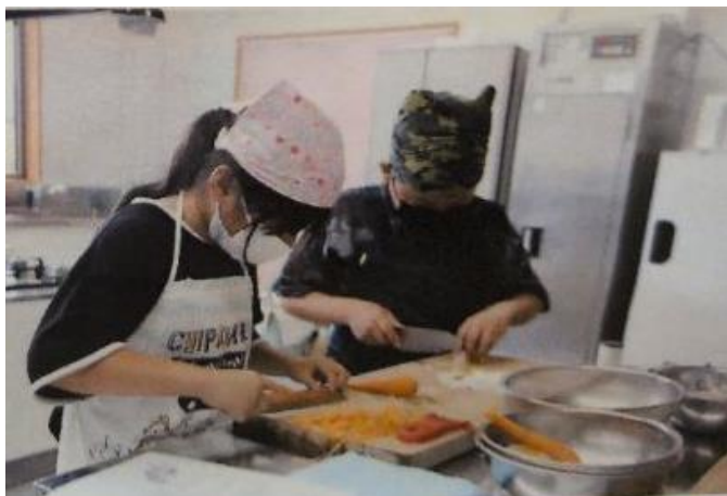
昨年の様子（南山田地区）

数年通わせてもらいましたが、より料理に対して興味を持ち、家でも積極的に調理をしてくれるようになりました。