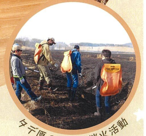
タデ原の野焼き消火活動