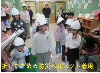
折りたどめる防災ヘルメット着用