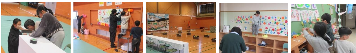
【卒業式前日の会場づくりの様子 在校生が分担して体育館・6年教室・児童玄関の装飾を準備しました】

3月24日(火)に本校体育館において、第80回卒業証書授与式が行われました。前日は雨が降り、天候が心配されましたが、卒業式当日は、晴れ間が多い、まさに卒業式日和といった天気でした。今年の卒業式では、5名の6年生が淮園小学校を巣立っていきました。6年生が下級生にとっても優しく関わってくれていたため、在校生も6年生とはとても深い絆で繋がっています。式練習では、リハーサル時から涙ぐんでいる在校生が多くいて、このつながりの深さが淮園小学校の伝統なんだということを改めて感じました。会場の方は、前日に1年生～5年生で分担して会場設営を行いました。体育館には6年生が最後に仕上げた大きなステーション画が飾られていて、6年生が通る花道には、今年「人権の花」運動で育てたたくさんのプランターの花が並んでいます。また、地域の方からも卒業式で飾ってくださいとあって、花を寄贈してくださいました。お心遣いが、大変ありがたかったです