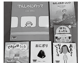
▲おはなし会で読んだ本