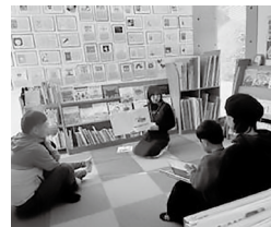
▲3月おはなし会の様子

4月の担当グループは「スター」のみなさんでした。5月は「ぶちトマト」(5/9 予定)のみなさんです。参加してくれたお友だちにはささやかなプレゼント(紙風船やジグソーパズルなど)を用意しています!シールも選んで貼ってくださいね!