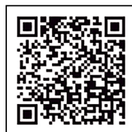
▲九重町ハザードマップ