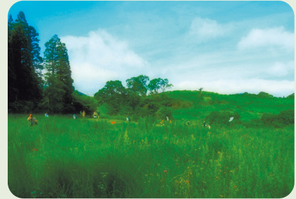
▲九重ふるさと自然学校 開園日は事前にご確認ください。