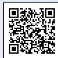
▲日田玖珠広域 消防本部 HP