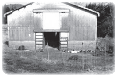
現在活用されていない施設

有吉 補助事業により設置された畜舎・倉庫・ハウス等が、当事者の高齢化や死亡により現在活用されていない施設は、新規就農者等に活用の斡旋はできないか。