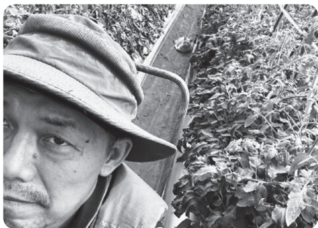
トマトハウスの中

夏から秋にかけて、トマト、米、しいたけと多角経営で頑張っていますが、個人での頑張りには限界があるので色々と考えています。