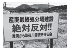
各所に設置された看板

引き続き、当委員会において産業廃棄物処理施設の設置に関して調査・研究し、議会としての行動を提案することも全体で確認しました。