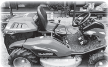
(貸出し乗用草刈り機)