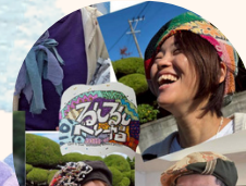
ベレー帽 ふうみんのるんるん工房