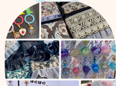
ハンドメイド雑貨 ワークショップ はぐはぐ