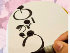
筆ペンアート体験 ともちゃん工房