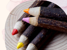
木製雑貨など やまよろず