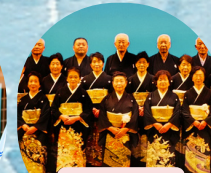
淡窓伝光霊流 玖珠詩道会