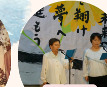
詩吟・詩舞 錦城会