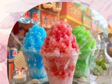
かき氷・ポテト キッチンカーFANCAFE