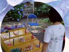
てっちゃんの 輪投げ