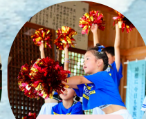
キッズダンス ここのえ夢クラブ