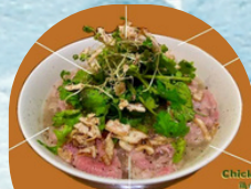
ビーフ・チキンフォー SURU SURU ASIA NOODLE SHOP