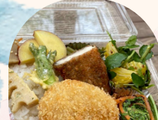
手作りコロッケ弁当 虹色の木もれ陽