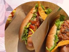
ホットドック 月ときりん