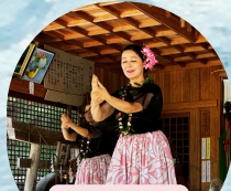
オリオリフラ Hula”フラ”