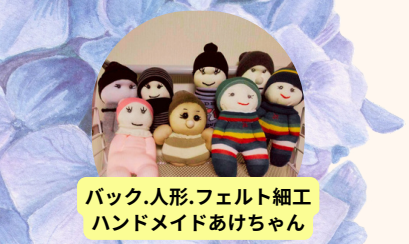
バック、人形、フェルト細工 ハンドメイドあけちゃん