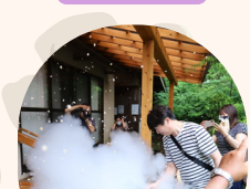
賑わい隊の ボン菓子体験