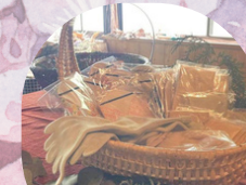
草木染め 焼き菓子 おかげさまCafeにこん