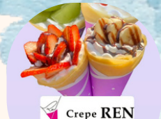
Crepe REN クレープ屋さん Crepe REN