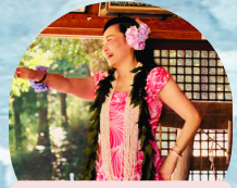
玲子ナニエキエエア Hula”フラ”