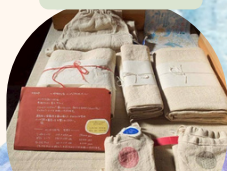
ふんどしパンツ かずみのふんぱん屋