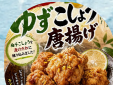
ゆずこしょう唐揚げ ほっこり亭