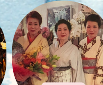
日本舞踊 富士嶺流会