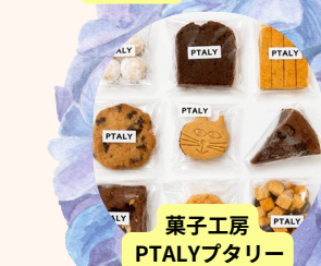
菓子工房 PTALYブタリー